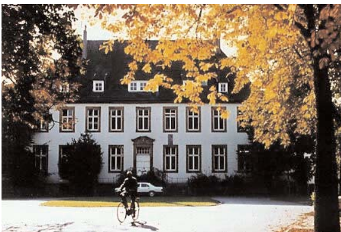
Auch im Alten Amtshaus auf dem Reckenberg aus dem Jahre 1726 sind Teile der Kreisverwaltung Gütersloh untergebracht

Darüber hinaus soll in diesem Zusammenhang überprüft werden, wie die bisher genutzten "Roaming Profiles" mit Hilfe von Empirum Personal Backup abgelöst werden können.