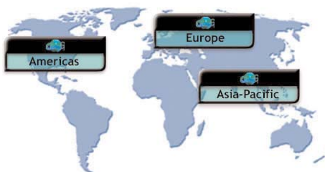
Die OM Group - ein global agierender Konzern

Um konzernweite Softwareeinführungen zentral steuern und reibungslos durchführen zu können, war man neben einer leistungsstarken Softwareverteilung auch auf umfangreiche Daten über die Clientumgebung angewiesen. Empirum ermöglicht dies durch integrierte Inventarisierung und Reportingfunktionalitäten. Im Tagesgeschäft sollte vor allem auch der wachsenden Anzahl mobiler Notebook-User Rechnung getragen werden. Wie Dietrich Endres, Leiter Computer Center bei OMG und damit zuständig für den gesamten PC-Betrieb erläutert, soll die Lösung im ersten Schritt auf den Standort Hanau beschränkt werden. Dies betrifft 1.100 User. Nach den hier gesammelten Erfahrungen werden im nächsten Schritt weitere Niederlassungen im deutschsprachigen Raum involviert werden, was ungefähr die Hälfte der insgesamt 3.500 Mitarbeiter ausmacht.